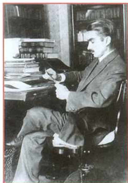
Lobato. Escritor sabia que uma criança aceitaria sem reservas suas fantasias

Nascido em 1942, recebeu vários prêmios literários, como o Jabuti e o da Câmara Brasileira do Livro. Com mais de 70 livros publicados e vendas acima de 20 milhões de exemplares, suas obras mais conhecidas são A Droga da Obediência , A Droga do Amor , A Marca de uma Lágrima , Pântano de Sangue , É Proibido Miar , Cavalcando o Arco-Íris e Agora Estou Só . Vive atualmente em São Roque (SP).