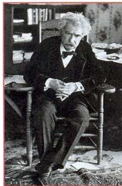
Mark Twain. Autor não precisa de adaptação para ser lido por um garoto de hoje